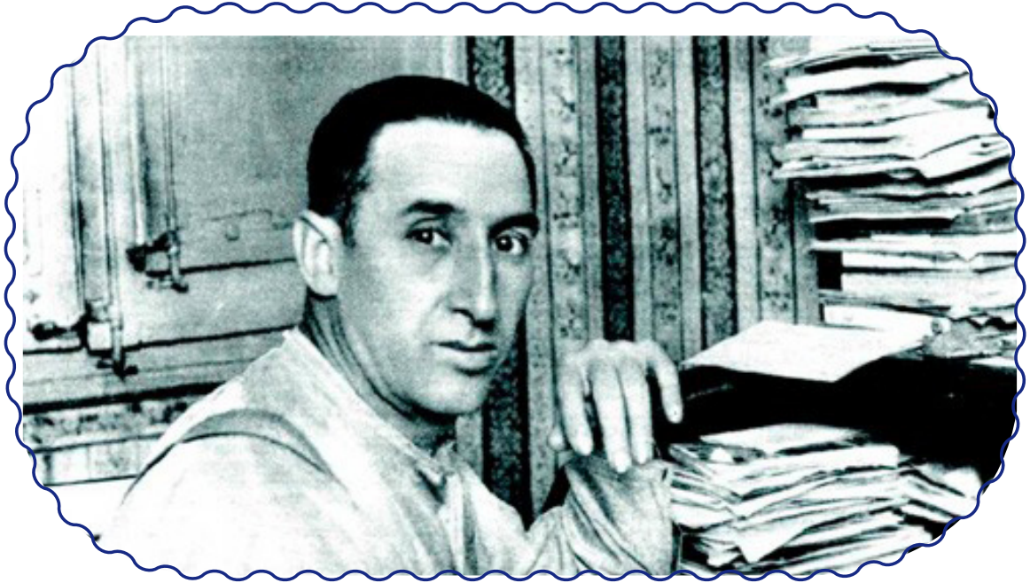
Angel Pestaña: El obrero español que se enfrentó a Lenin