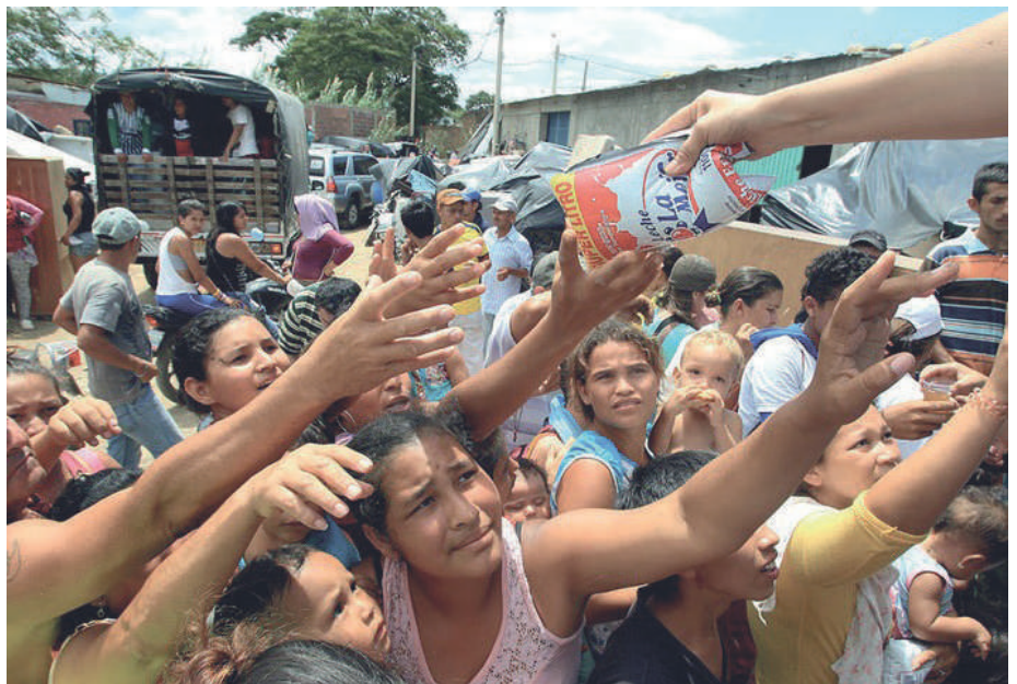
La imposición de una cultura de muerte a cambio de comida

y transitoria, viene con un conjunto de programas contemplados en los Objetivos de Desarrollo Sostenible, entre ellos, la llamada "salud reproductiva" que no es otra cosa que el control de la natalidad. Por eso, el reparto de anticonceptivos y esterilizaciones (muchas de estas en mujeres muy jóvenes) que se observan en los hospitales públicos.