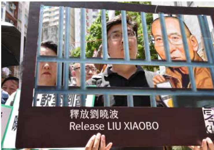
En 2008 promovió y redactó la Carta 08 un documento inspirado en la Carta-77 que Vaclav Havel y

otros disidentes checos habían redactado en 1977 contra el régimen comunista. En la Carta 08 pedía la libertad, la igualdad y la separación de poderes entre otras cuestiones.