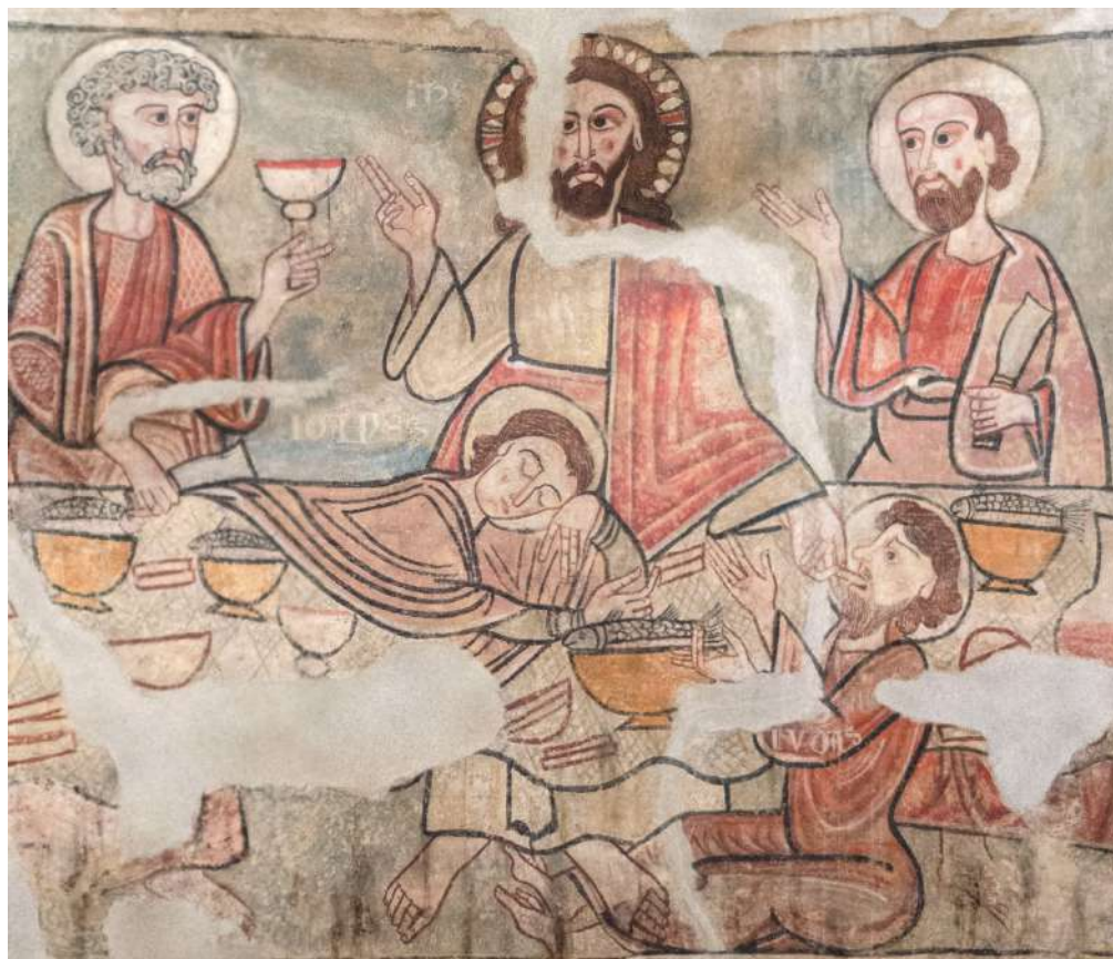
El cristianismo nace y crece por este acontecimiento único: la experiencia personal y comunitaria de que el Hijo de Dios nos ha asumido a todos nosotros al encarnarse en Jesús de Nazaret. En la imagen: fragmento de la representación de la última cena en la antigua capilla de Santa Catalina de la Catedral de La Seu d'Urgell. (1242-1255).

El emperador Constantino, después de convertirse en cristiano, legaliza la Iglesia (proscrita desde Nerón en el año 64), con el Edicto de Milán de 313. En el 380, el emperador Teodosio declara el cristianismo como religión oficial de todo el Imperio romano en el Edicto de Tesalónica. Estamos ante uno de los cambios más importantes en la historia de la Iglesia; no significó -ni mucho menos- una traición o cambio alguno del depósito de la fe, pero sí implicó modificaciones en los acentos y subrayados teológicos y -en consecuencia- en la práctica eclesial. Veamos las principales variaciones en la espiritualidad y cómo nos afectan a los actuales cristianos: