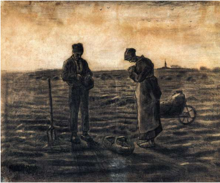
El ángelus , obra Van Gogh, año 1880 (versión de la obra de Millet del mismo nombre).

vocación, tratar de obtener el reino de Dios gestionando los asuntos temporales y ordenándolos según Dios» (LG 31). Tiene como columna de su espiritualidad la caridad política (Pío XI), San Pablo VI describía dicha caridad diciendo: «El campo propio de su actividad evangelizadora, es el mundo vasto y complejo de la política, de lo social, de la economía, y también de la cultura, de las ciencias y de las artes, de la vida internacional, de los medios de comunicación de masas, así como otras realidades abiertas a la evangelización como el amor, la familia, la educación de los niños y jóvenes, el trabajo profesional, el sufrimiento, etc.» ( Evangelii Nuntianti , 70).