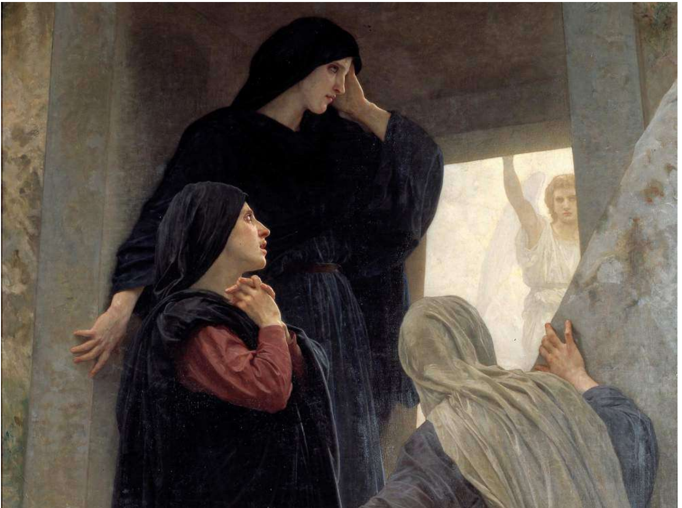
Las santas mujeres en la tumba, obra de William-Adolphe Bouguereau, año 1890.

El Espíritu Santo ha regalado a su Iglesia diversidad de movimientos, asociaciones y grupos. Pero la mera existencia de esta pluralidad de carismas no puede contentarnos, ya que es necesario que entre ellos vivan en Comunión y todos participen del único Cuerpo de la Iglesia guiados por el carisma de discernimiento de los sucesores de los apóstoles. Además, es necesario que se abran a lo que les falta, a lo que les aportan los otros carismas; de lo contrario, podemos pasar de la pluralidad a la fragmentación estéril.●