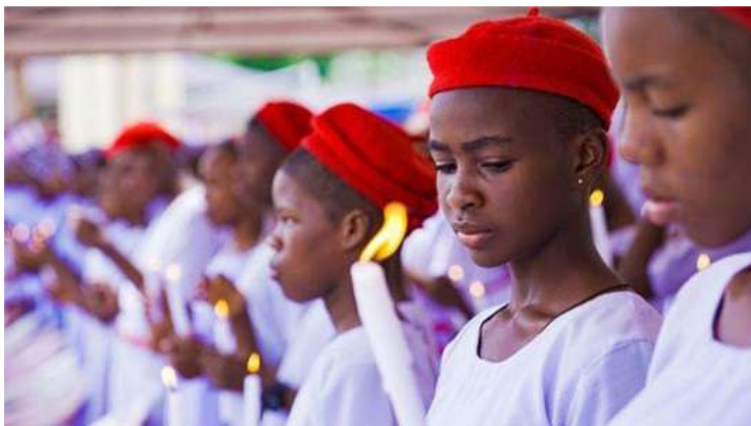
Grupo de niñas reciben los sacramentos del bautismo y la confirmación en Onitsha, Anambra, Nigeria, mayo de 2022.

¿De qué nos hablan, en resumen, estas variadas «sorpresas estadísticas»? de que la buena vida es un gran riesgo para la vida buena y de que, parafraseando a Mounier, la fe (él decía la persona) «solo se desarrolla en un ambiente existencial de riesgo».