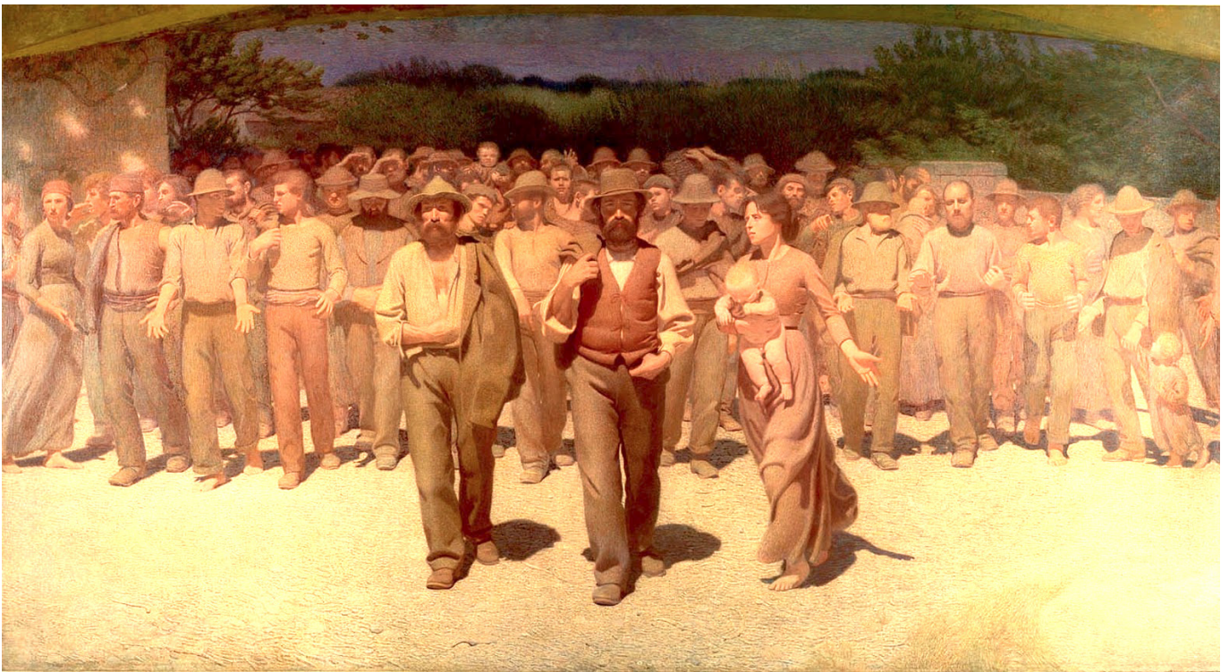
«Destruídas o debilitadas las estructuras solidarias del ser humano, este queda sometido directamente a los arbitrios del poder político-económico del neocapitalismo». Imagen: Il quarto stato (1901), de Giuseppe Pellizza da Volpedo, Museo del Novecento (Milán).

poder político-económico del neocapitalismo.