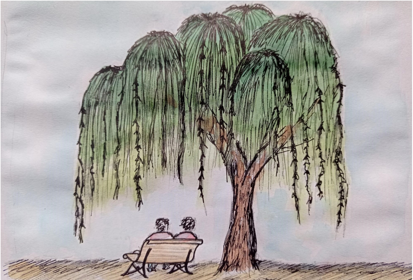
«Bajo el sauce», Julia Gaya (2022).

vida, que no somos dueños absolutos de nuestra vida, ni de la de nadie, sino más bien custodios, custodios de la vida, porque la vida es un don.