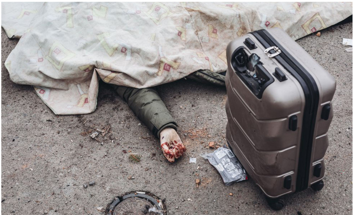
Víctima del bombardeo ruso a los civiles que huían de la ciudad ucraniana de Irpín (6 de marzo 2022).

cito, milicias independentistas (Ambazonia), yihadistas (Boko Haram –JAS– e Islamic State OF West Africa–ISWA–). 28. Burkina Fasso: ejército, yihadistas (Al-Qaeda –JNIM–, Ansaroul Islam, Islamic State Grand Sahel). 29. Kenia: ejército, yihadistas (al-Shabab y Al Hijra). 30. Israel (Palestina): ejército, milicias (Hamas: brigadas al-Qassam), yihadistas (brigadas al-Quds apoyadas por Irán), alzamiento popular (intifada). 31. Chad (zona del Lago Chad): ejército, milicias, yihadismo (Boko Haram –JAS– e Islamic State in West Africa), mercenarios (Wagner). 32. Argelia: ejército, yihadistas (Al-Qaeda in the Maghreb). 33. Azerbaiyan y 34. Armenia (Nagorno-Karabaj): ejércitos de ambos países y milicias. 35. Níger: ejército, milicias (tuareg-fulani), yihadistas (Al-Qaeda –JNIM–, Ansaroul Islam, Islamic State –ISGS e ISWA–, Boko Haram –JAS–). 36. Bangladesh: ejército, crimen organizado, milicias comunistas (Janajuddha –PBCP-J–), islamismo (Jamaat-e-Islami, IS). 37. Indonesia (Timor, Aceh, West-Papua): ejército y milicias (Free Papua Movement, Free Aceh Movement), islamismo (Jemaah Islamiya ). 38. Mozambique: ejército y yihadistas (al-Shabaab). 39. Honduras: ejército, policía, crimen organizado (M 13). 40. El Salvador: policía, crimen organizado (Mara Salvatrucha –MS 13–: cocaína y otras drogas) y bandas criminales (tasa de homicidios más alta del mundo). 41. Haití: bandas criminales (más de 200), ejército, policía (interrelacionados con las bandas).●