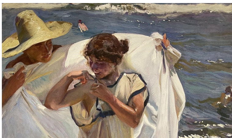
En la imagen de portada: Después del baño , Joaquín Sorolla. 1908.