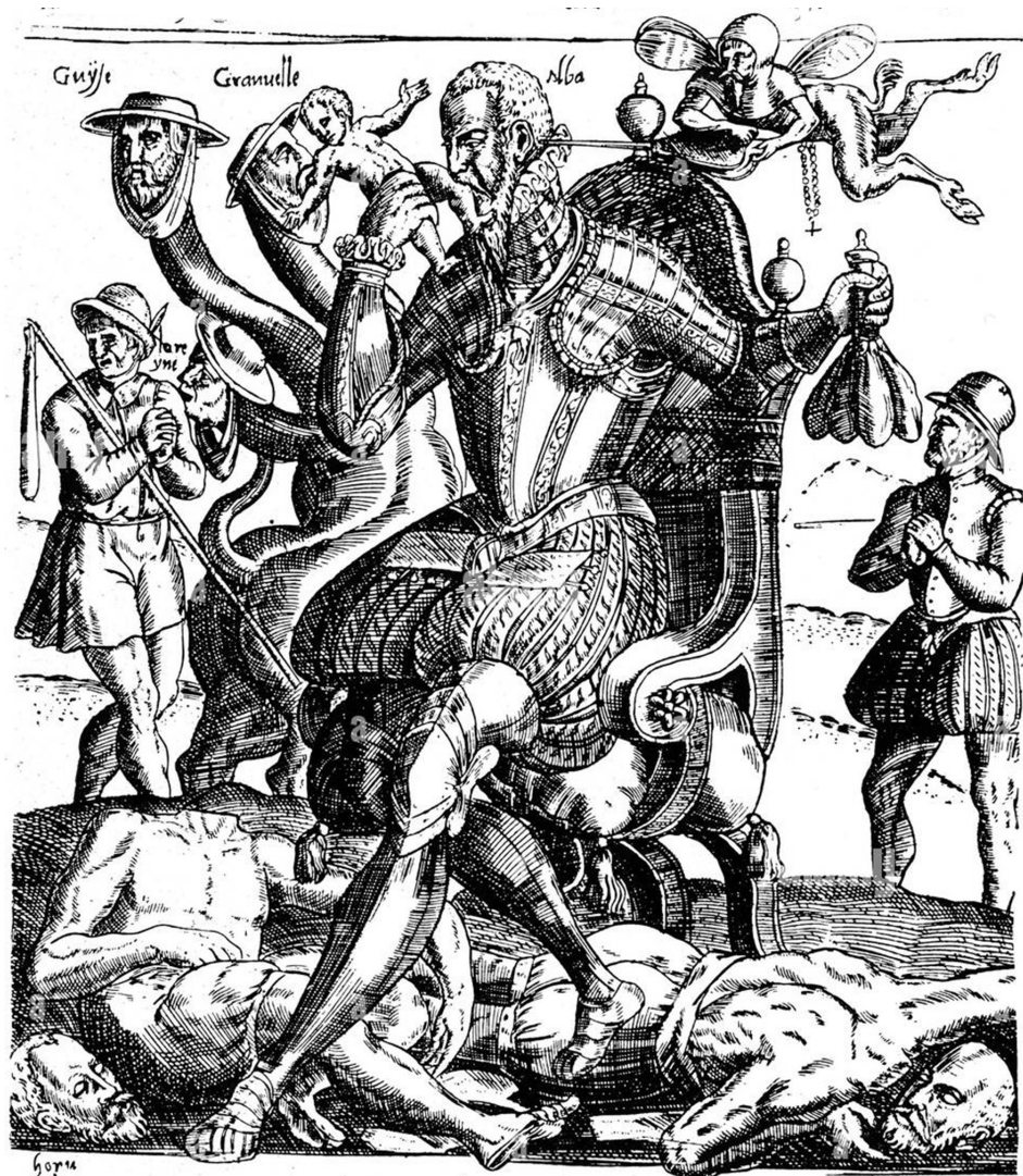
«El mito de la Inquisición surge durante el siglo XVI en el marco de la política internacional de la época, dominada por la guerra». En la imagen, grabado protestante que muestra al Duque de Alba –vencedor de la Batalla de Mühlberg– comiéndose a un niño. Xilografía de Frans Hogenberg, 1572

Los inquisidores se preocuparon más de que los acusados se arrepintiesen que de condenarlos. Por tanto, un «auto de fe» no suponía la muerte deliberada por tortura