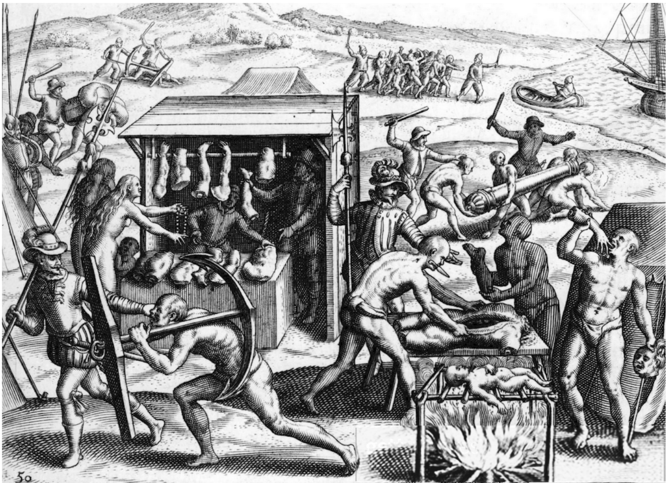
Grabado de Theodor de Bry (1528-1598) ilustrando una versión de la Brevísima relación de la destrucción de las Indias , de Bartolomé de las Casas. Afincado en Frankfurt, fue un pseudo historiador del descubrimiento de América (donde nunca estuvo). Sus grabados fueron reproducidos insistentemente por holandeses e ingleses.