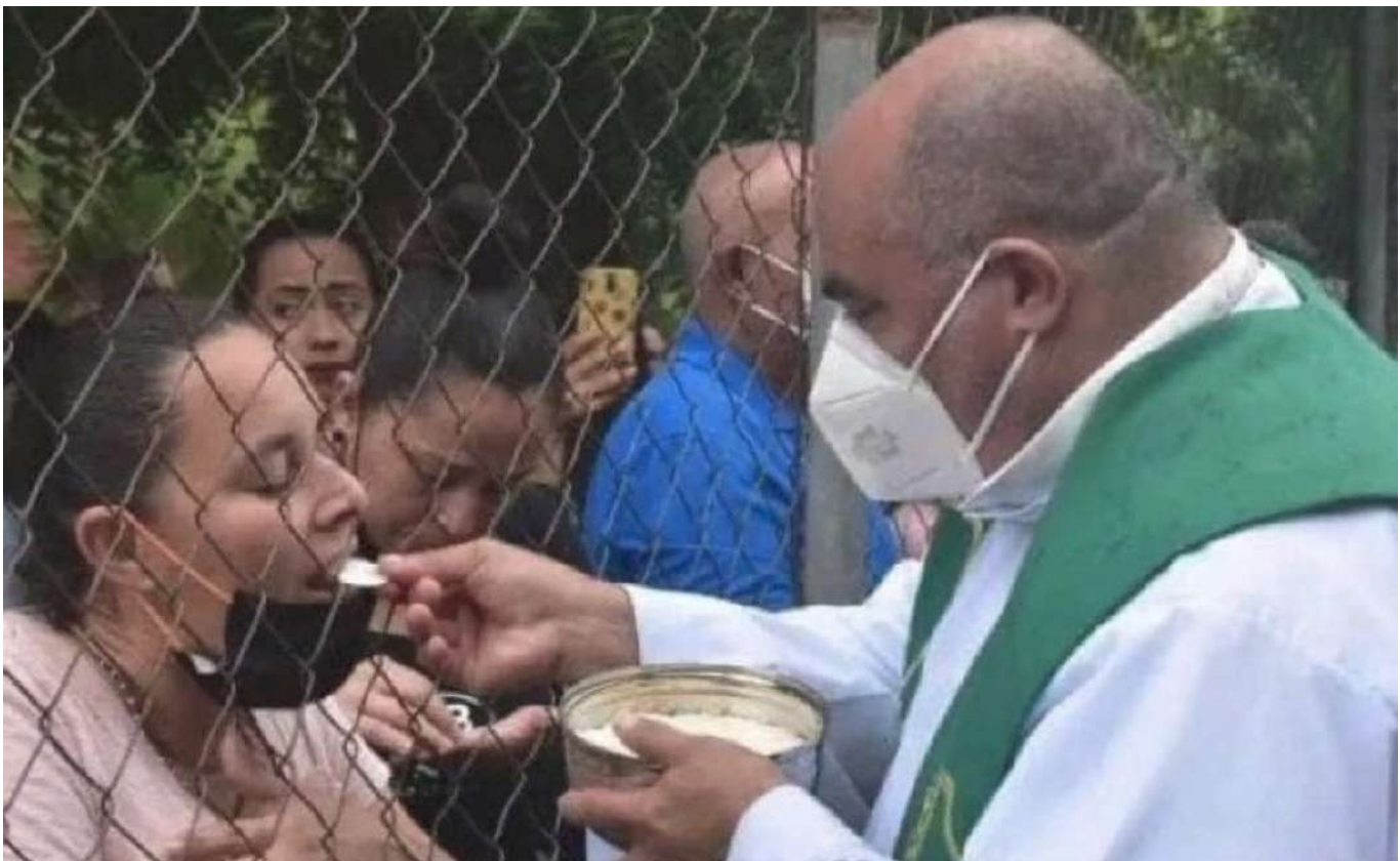
En la imagen, los fieles comulgan a través de la reja del patio en la Iglesia de Santa Lucía (Ciudad Darío, Nicaragua) cerrada por el gobierno (16 de agosto de 2022).

¿Cómo crecer en esta lectura cristiana de la realidad? El Apocalipsis nos dice que la oración alimenta en cada uno de nosotros y en nuestras comunidades esta visión de luz y de profunda esperanza: nos invita a no dejarnos vencer por el mal, sino a vencer el mal con el bien, a mirar a Cristo crucificado y resucitado que nos asocia a su victoria. La Iglesia vive en la historia, no se cierra en sí misma, sino que afronta con valentía su camino en medio de dificultades y sufrimientos, afirmando con fuerza que el mal, en definitiva, no vence al bien, la oscuridad no ofusca