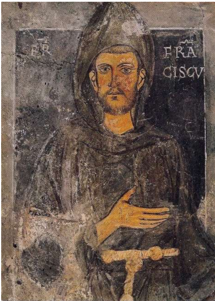
Fresco del Monasterio de San Benedetto en Subiaco, Italia (1223-1224), el más antiguo que se conserva de san Francisco, dos años antes de su muerte. Se considera que el artista pudo haberlo visto en persona o basarse en una descripción directa. Coincide con las crónicas de la época, como la de Tomás de Celano. Su cinturón, una cuerda simple con nudos, es el símbolo de la orden naciente.

En esta fraternidad, la solidaridad ocupa un lugar central. Para Francisco, solidarizarse no era un acto puntual, sino una manera de vivir. Significaba cargar con la necesidad del otro, reconocer que la vida humana es interdependiente y que el bien individual nunca puede separarse del bien común. La solidaridad franciscana no es paternalismo ni beneficencia: es cercanía que dignifica, servicio que une, compromiso que reconstruye los vínculos sociales rotos. En un tiempo marcado por desigualdades y polarizaciones, esta virtud se vuelve decisiva para regenerar nuestras comunidades.