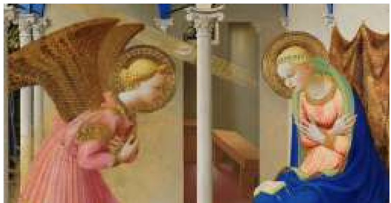
«El cristianismo comienza con un acontecimiento que parece insignificante: el consentimiento de una mujer en un lugar humilde del mundo antiguo», Detalle de La anunciación (c. 1425–1428), Fra Angelico (Italia, c. 1395/1400–1455). Museo del Prado (España).

María permanece así, no solo como modelo de fe y obediencia, sino como guía permanente de la Iglesia y del cristianismo en la transformación de la realidad temporal, demostrando que la historia humana está siempre abierta a la gracia y a la esperanza. ●