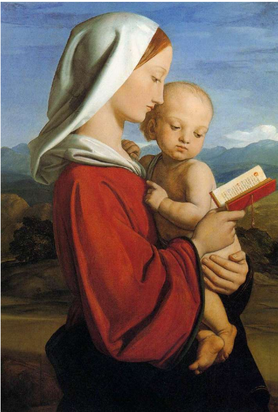
«Cristo es Hijo del Padre en la eternidad e hijo de María en el tiempo; es engendrado por Él y consustancial con Él a la vez que engendrado por María y consustancial con ella». Virgen con el niño (1845) de William Dyce (Escocia 1806–1864), Royal Collection Trust (Reino Unido).

Si aplicamos lo expuesto al estudio sobre María, es decir, el predominio del dualismo, de la fragmentación y de la desontologización, nos encontramos con graves problemas en la mariología contemporánea.