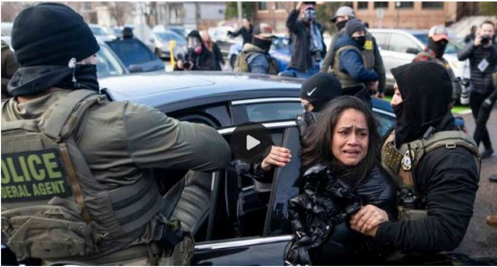
Agentes de ICE (la policía migratoria de los EE. UU.) detienen a una migrante indocumentada. Captura de un noticiero, 2026.

el 1 de julio y The Lancet publicó un estudio que detalla las consecuencias trágicas para millones de beneficiarios en todo el mundo, como enfermos de malaria, tuberculosis y VIH, o los programas de vacunación que ya no serán financiados. De modo que este supuesto ordo amoris provocará la muerte en comunidades de origen de la migración.