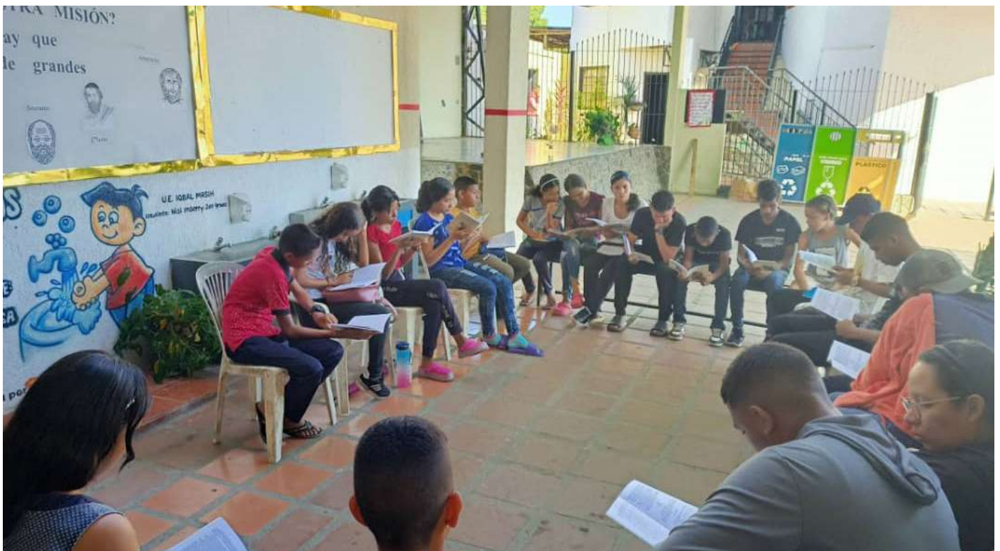
Jóvenes de Camino Juvenil Solidario de una barriada pobre de Venezuela haciendo lectura en común

Solo la vida de lucha por la justicia, asociada, es respuesta. Cada instante, cada rincón, cada corazón que se libera en cualquier parte del mundo es un pedazo de Eternidad aquí en la Tierra. Por ello, con inmensa alegría afirmemos la virtud de la Esperanza frente a los poderosos... "De derrota en derrota hasta la Victoria Final".●